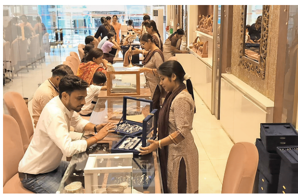
खलीलाबाद के गोला बाजार में आभूषण खरीदते लोग