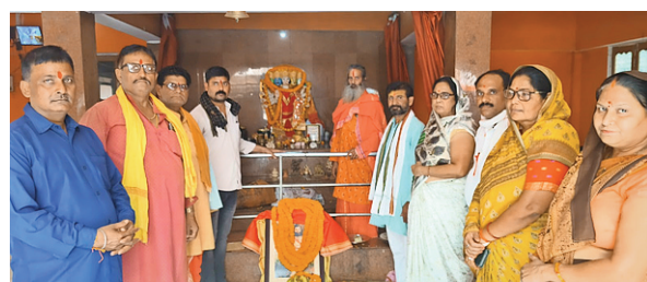
महर्षि परशुराम जयंती पर खलीलाबाद के समय माता मंदिर परिसर में पूजन-अर्चन करते श्रद्धालु

जागरण संवाददाता, संतकबीर नगर: महर्षि परशुराम की जयंती शुक्रवार को श्रद्धा व उमंग से मनी। विधिविधान से पूजन-अर्चन करके महान कार्यों का स्मरण करने नमन किया गया। एक स्वर में जयकारा लगाते हुए आदर्शों पर चलने का संकल्प लिया गया। खलीलाबाद स्थित समय माता मंदिर में पूजन-अर्चन हुआ। परिसर स्थित पंचमुखी हनुमान मंदिर में जयंती मनाई गई। मंत्रों के बीच पूजन हुआ।