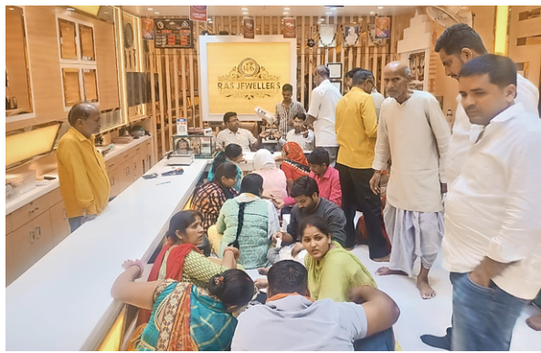
अक्षय तृतीया पर खलीलाबाद सराफा बाजार में हो रही खरीदारी • जागरण

जागरण संवाददाता, संतकबीर नगर : अक्षय तृतीया पर शुक्रवार को सौभाग्य व धन-धान्य की वृद्धि की प्रार्थना हुई। अक्षय निधि का संचय करके भंडार भरने के ध्येय से जमकर खरीदारी हुई। सोने-चांदी के साथ हीरे के आभूषण खरीदारी हुई। अधिकांश लोगों ने सिक्के के साथ अन्य सामग्रियों को खरीदने में उत्साह बना रहा। जनपद में करीब 52 करोड़ रुपये के कारोबार का अनुमान है। पर्व को लेकर सराफा बाजार में रौनक रही। खलीलाबाद के गोला बाजार में सुकह से ही खरीदार पहुंचने लगे।